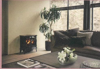
広いリビングでも存在感を発揮する「バーゲイト」は、インテリアとしても活躍が期待できる。[W62×H66×D39cm] 13万8240円 (ディンプレックス・ジャパン ☎03-6453-7241)

世界で初めてオイルヒーターを製品化したディンプレックスが提案する電気暖炉。置く場所に困らない新時代の暖炉が演出するとこでもリアルな炎は、我が家に憩いの時間をもたらしてくれる。温かみのあるデザインも僕ら好み。室内からアウトドアまで対応可能だから、用途に見合うベストの一台を選びたい。